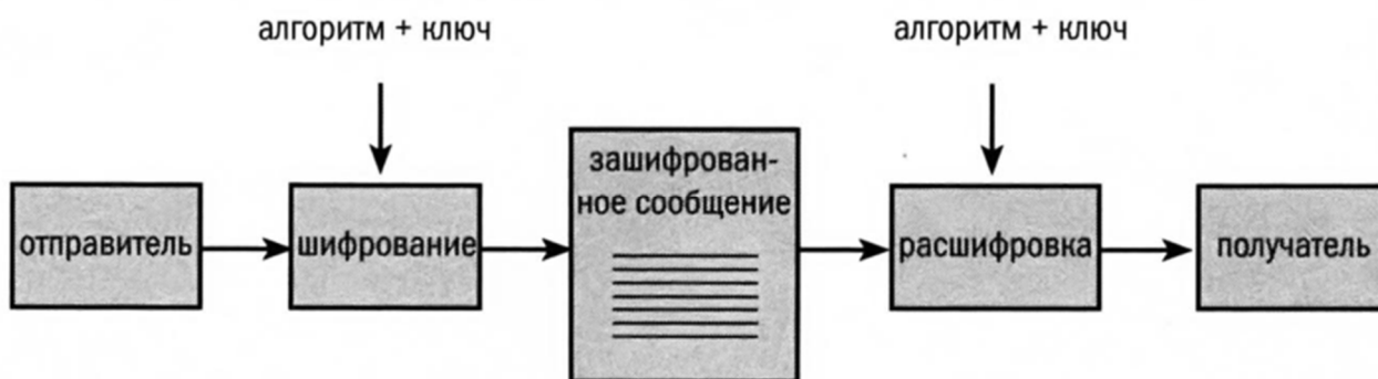
Рис.2.Схема шифрования 8

На рис.2 представлен процесс передачи зашифрованного отправителем сообщения для получателя. Человечество, как "получатель", должно совершить процесс "расшифровки", отыскав "алгоритм + ключ".