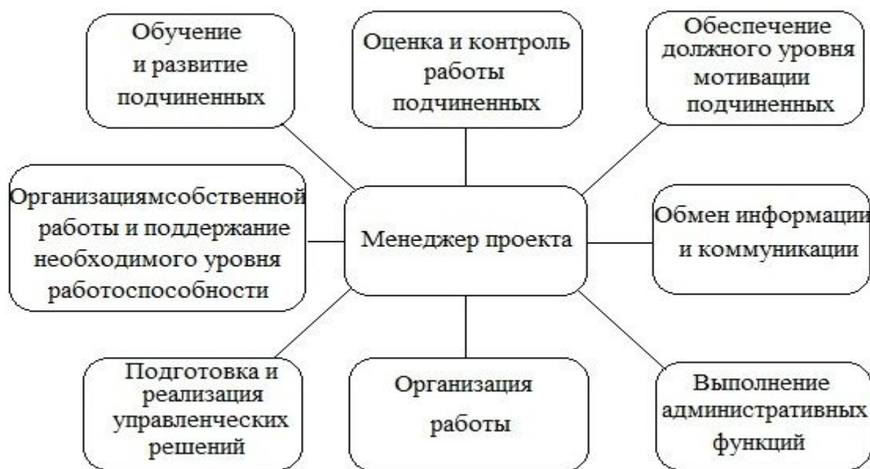
Рисунок 1. Сферы компетентности менеджера проекта в сфере гостиничного бизнеса. 1

Каждый успешный руководитель должен обладать высокой управленческой компетентностью. То есть ему необходимо не только отлично знать профессиональную область, но и обладать умениями и знаниями в сфере проектного управления. Только в случае применения всех этих правил менеджер сможет добиться успеха. Самым первым и основным правилом руководителя проектов является - знание всех основных компетенций менеджера и их особенностей. Мы составили схему компетенций менеджера проекта и представили ее на рисунке 1.