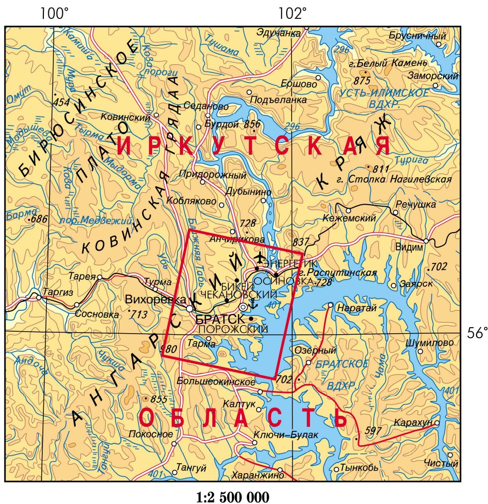
Рис.2 Карта - Братское водохранилище название заливов

https://geographyofrussia.com/wp-content/uploads/2014/12/299-239.jpg