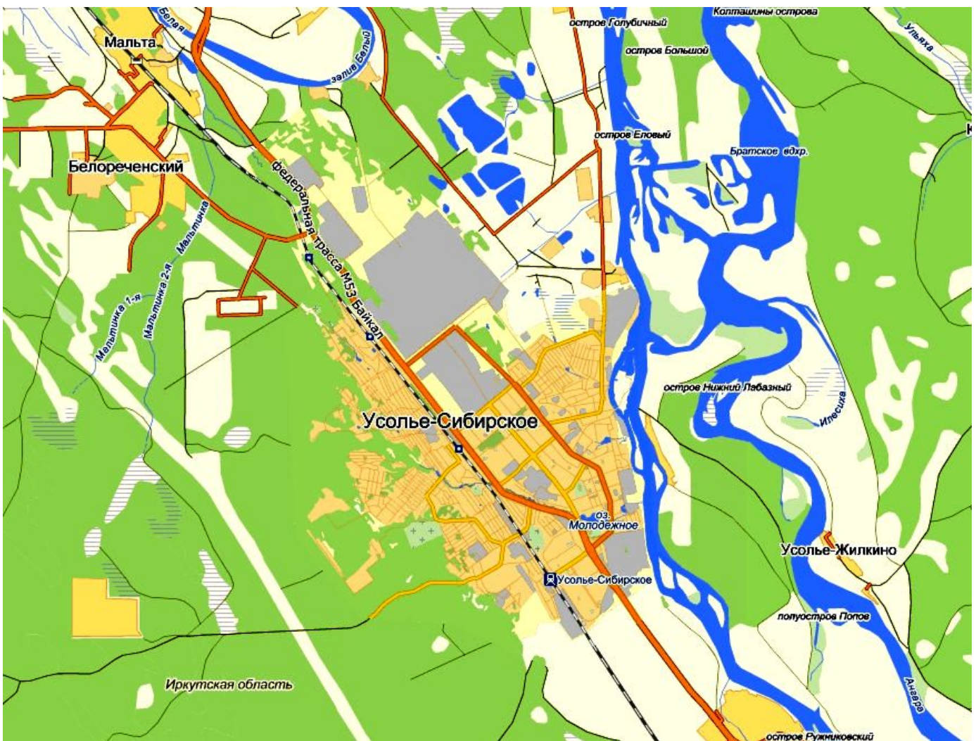
Рис. 3 Карта города Усо́лья-Сибирского http://izofun.ru/usole-sibirskoe-karta [18]

Так как автор имеет грустный опыт общения с отечественными «зелёными начальниками» всех рангов, включая руководителей промпредприятий, муниципалитетов, регионов и правительственных чиновников (см., например, [15], [16], [17] и др. ), учитывая отечественный опыт, как «кадры решают всё», здесь можно с большой вероятностью построить ДЕЙСТВИТЕЛЬНО НЕОБХОДИМЫЕ ЦЕЛИ, ЗАДАЧИ И ОБЪЁМЫ ДЕМЕРКУРИЗАЦИИ ЦЕХА РТУТНОГО ЭЛЕКТРОЛИЗА УСОЛЬЕ-СИБИРСКОГО ХИМКОМБИНАТА