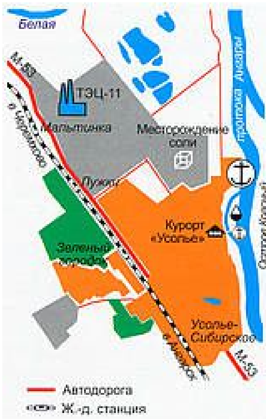
РИС. 4 УСОЛЬЕ-СИБИРСКОЕ, ИРКУТСКАЯ ОБЛАСТЬ], [19] http://www.pribaikal.ru/usolye-sibirskoe.html

на пойменной возвышенности левого берега Ангары, недалеко от места впадения в нее реки Белой, на высоте 430 м над уровнем моря...» Эти сведения были изменены Решением Думы г. Усолье-Сибирское от 09.12.2013 N 116/6 [21]: О внесении изменений в генеральный план муниципального образования "город Усолье-Сибирское", утвержденный решением городской Думы города Усолье-Сибирское от 17.07.2009 N 43/4 (с изменениями от 26.09.2013 N 76/6)