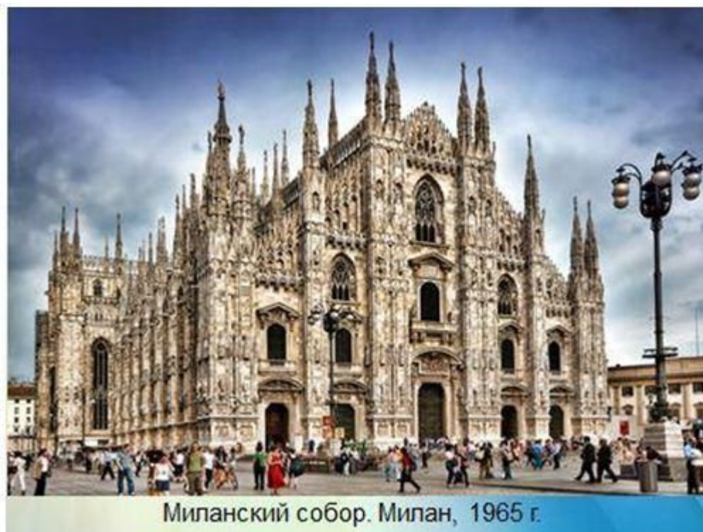
Миланский собор. Милан, 1965 г.

Архитектурный стиль Ренессанс (Возрождение) появился в Европе в 14-16 вв. Стиль вернул в архитектуру античные традиции, ордерную систему, которые сочетались с национальными мотивами и местными строительными материалами. В сооружениях подчеркивается простота линий, плоскости, пропорциональность, симметрия, ритмичность членения фасадов, горизонтальное направление. Возвращается соразмерность габаритов строения и размеров человеческого тела. При строительстве в архитектурном стиле Ренессанс используются элементы ордерной системы. Первым зданием в стиле Ренессанс стал Воспитательный дом архитектора Ф. Брунеллески (1377—1446 гг.) во Флоренции (1421 г.). Дальнейшее развитие общества вновь вело к усложнению структур и конструкций, что породило новый вид архитектурного стиля – барокко.