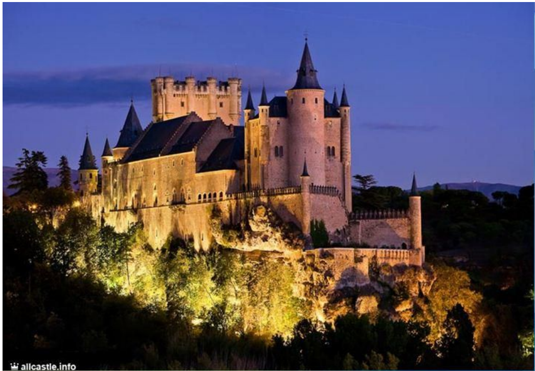
Замок Алькасар. Сеговия. 1120 г.

Вид архитектурного стиля – готика в течение века (с середины 12-го до середины 13-го вв.) сменил романский стиль. В основе готических сооружений – конструкция каркасной системы со стрельчатыми сводами, арками. Первые готические соборы появились в Северной Франции. Церковь, созданная по новому проекту в 12 в. в аббатстве Сен-Дени под Парижем под руководством аббата Сугерия стала образцом готического архитектурного стиля. Такого рода сооружения появились в провинции Иль де Франс, а также на территории современной Бельгии и Швейцарии. Затем стиль дошел до Германии, Англии, Испании. После крестовых походов этот вид архитектурного стиля был внедрен в Сирии, Кипре, Родосе. В 14 в. в готическом архитектурном стиле возводили и городские сооружения, такие как ратуши. Например, ратуша в Сен-Кантене с богатым декором, башней по центру фасада. Когда укрепилась государственность и необходимость домов-крепостей отпала, вместо замков стали возводить дворцы с элементами готического стиля. В поздней готике зародился новый архитектурный стиль – Ренессанс, основывающийся на иной идеологии, которая, как в эпоху античной Греции, характеризовалась уважением к человеческой личности [3].