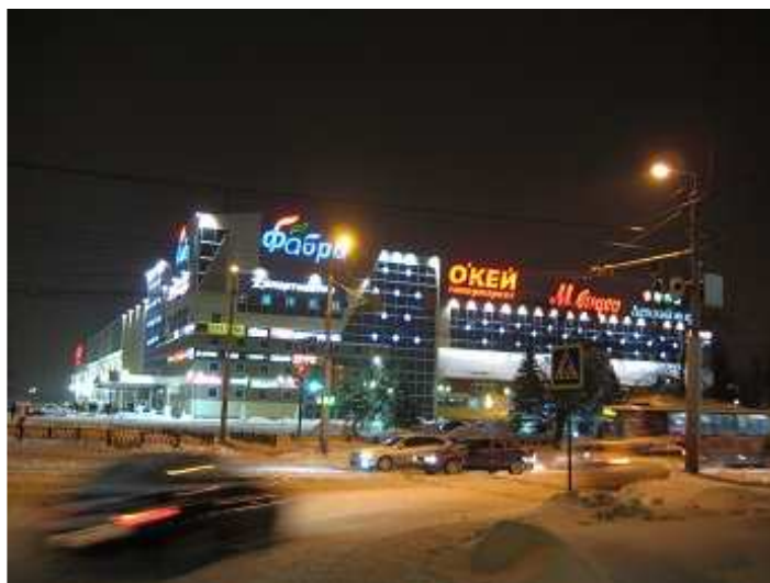
А так он выглядит вечером

По правде, это можно легко объяснить, событие было довольно заметным. Действительно, некоторое время назад на оживленной трассе рядом с «Фабри» два мотоциклиста устроили сумасшедшую гонку. Стрит-рейсинг закончился печально. Одного из них «подрезала» легковушка и он, упав на огромной скорости, столкнулся с чем-то (столбом, бордюром ли другим транспортным средством).