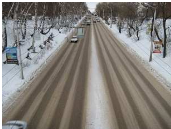
Улица Худайбердина, на которой произошла трагедия. Перекресток находится вверху фотографии, а слева там же - ТРЦ «Фабри». Вид с ж/д моста.