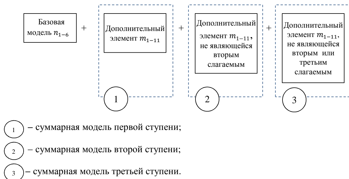
Рисунок 2 – Принцип формирования суммарных моделей муниципально-частного партнерства

Принцип формирования суммарных моделей муниципально-частного партнерства представлен на рисунке 2.