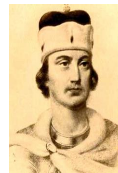
Рисунок 6 - Федор Ярославич