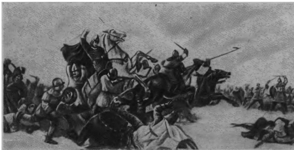
Рисунок 15 – Последний подвиг Александра Невского

В 1245 году на города Торжок и Бежецк двинулось литовское войско под предводительством Миндовга. Когда люди, интересующиеся жизнью великого полководца, спрашивают: « Каков последний подвиг Александра Невского? », исследователи отвечают, что это, бесспорно, разгром литовцев. Освободив Торопец, князь Александр убил десять князей-литовцев. После этого он распустил новгородцев по домам и силами своей дружины догнал и полностью разбил литовское войско у озера Жизца. Возвращаясь в Новгород, княжеская дружина одолела еще один отряд литовцев. Дружина Александра являлась грозной силой. Даже упоминание о ней приводило недругов в ужас. 3 подвига Александра Невского, которые он совершил со своими доблестными воинами, не могли не дойти до Батые. После разгрома литовцев Александра «вызвали» в Орду [4].