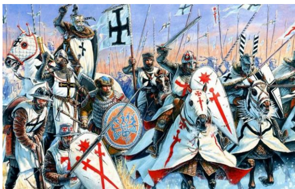
Рисунок 8 - Князь Ярослав Всеволодович

Ещё в 1236—1237 годах соседи Новгородской земли враждовали друг с другом (200 псковских воинов (рис.8) участвовали в неудачном походе Ордена меченосцев против Литвы, закончившемся битвой при Сауле и вхождением остатков ордена меченосцев в состав Тевтонского ордена), но уже в декабре 1237 года папа Григорий IX (рис. 9) провозгласил второй крестовый поход в Финляндию, а в июне 1238 года датский король Вальдемар II (рис.10) и магистр объединённого ордена Герман Балк (рис.11) договорились о разделе Эстонии и военных действиях против Руси в Прибалтике с участием шведов[2].