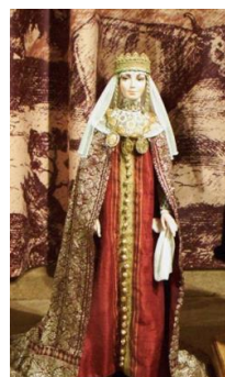
Рисунок 4 - Александра дочь Брячислава Полоцкого