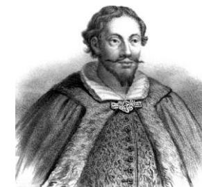
Рисунок 7 - Биргер

В 1236 году Ярослав уехал из Новгорода княжить в Киев (оттуда в 1238 году — во Владимир). С этого времени началась самостоятельная деятельность Александра. В 1238 году, во время монгольского нашествия на Северо-Восточную Русь, Юрий Всеволодович Владимирский ожидал полки братьев Ярослава и Святослава.