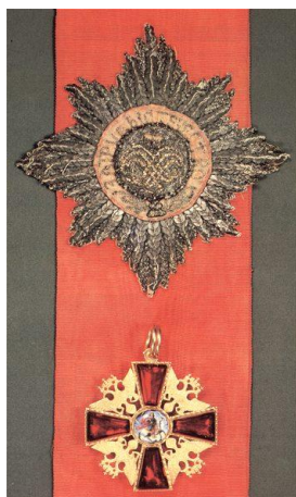
Рисунок 13 – Вид ордена при Екатерине I

Всего количество награждений орденом Александра Невского в период Отечественной войны составило более 42000, включая коллективные награды более 1470 воинских частей и соединений Красной армии и Военно-морского получили этот орден и право прикрепить его к своему знамени. Было проведено около 70 награждений иностранных генералов и офицеров, в том числе орден получил Краснознаменный истребительный авиационный полк «Нормандия-Неман». 6 июня 2002 года был подписан Учредительный договор «О Высшей Российской Общественной награде ордене св. Александра Невского «За труды и Отечество», который подписали видные государственные и общественные деятели Российской Федерации. [6]