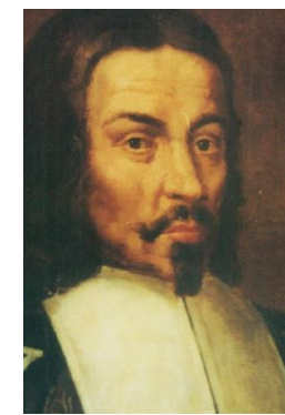
Рисунок 11 - Герман Балк

В 1239 году, по окончании войны с литовцами за Смоленск, Александр построил ряд укреплений на юго-запад от Новгорода по реке Шелони и женился на дочери Брючислава Полоцкого. Свадьба прошла в Торопце в храме св. Георгия. Уже в 1240 году в Новгороде родился первенец княжича, названный Василием.