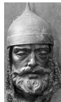
Рисунок 5 - Мстислав Удалой