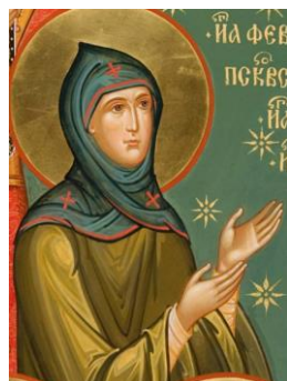
Рисунок 2 - Князь Феодосия