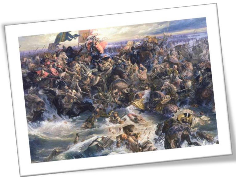
Рисунок 12 - Ледовое побоище Александра Невского.

За свою недолгую жизнь (1220—1263 гг.) князь Александр Ярославич, судя по письменным источникам, провел не меньше 12 битв и военных операций со шведами, немцами, литвой и во всех добился успеха. Для русского полководца того времени это факт удивительный. Большую часть военных предприятий Александр Ярославич осуществил в период, когда был новгородским князем (1236—1252 гг.). Начало княжения в Новгороде было особенно трудным и именно тогда, с почти внезапной силой обозначился яркий талант князя Александра, как военачальника, мастера решающих сражений.