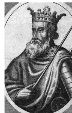
Рисунок 10 - Вальдемар II