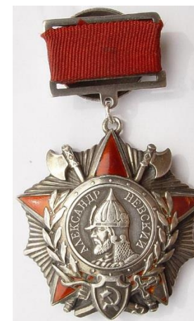
Рисунок 14 – Вид сталинского ордена «Александр Невский»