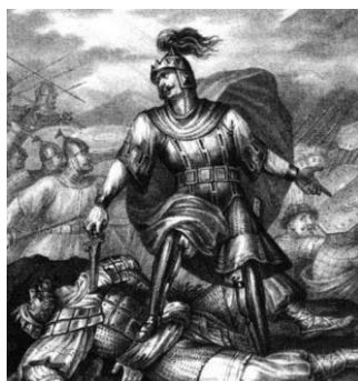
Рисунок 3 - Мстислав Удалой