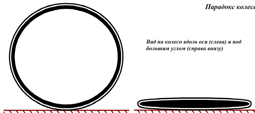
Рис.2. Если смотреть на колесо под большим углом, оно выглядит как эллипс. Окружность из утолщенной линии – это внешняя поверхность оси колеса. Окружность из тонкой линии – вращающийся обод (колесо). В анимированном виде изображение можно увидеть в [6].

Однако, присмотримся повнимательнее. Посмотрим на колесо под углом к его оси. Чем этот угол больше, тем сильнее «сплющивается» колесо, принимая вид вытянутого эллипса, что довольно заметно напоминает транспортер.