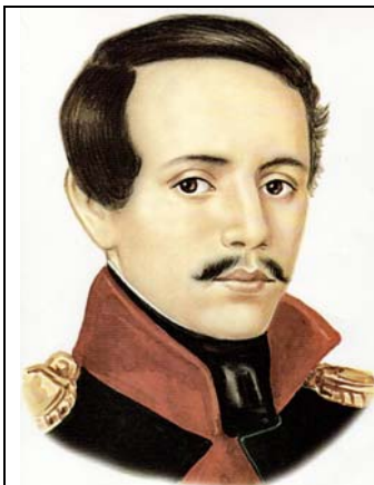
Лермонтов Михаил Юрьевич (1814-1841)