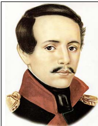
Лермонтов Михаил Юрьевич (1814-1841)