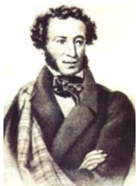
Рисунок так и остался только наброском (?) в альбоме художника. Альбом этот, к сожалению, до сих пор не (?) обнаружен (?) . Однако с рисунком не всё так просто. ...

В 1870 году внезапно появляется след (?) пропавшего рисунка – Александр Эрнестович Мюнстер, литограф и издатель, выпускает собрание портретов и биографических очерков «Портретная галерея русских деятелей». В ней он приводит литографированный «Портрет А.С. Пушкина», исполненный Петром Борелем, с пометкой «с гравюры Доу». О Бореле, к сожалению, нам (?) известно мало. Мы (?) знаем только, что он был достаточно педантичен, и скорее всего не мог допустить какую-либо ошибку. Конечно вполне возможно, что основой для литографии мог послужить другой рисунок Доу. Однако вероятность того, что перед нами (?) практически (?) именно тот (?) карандашный рисунок, весьма высока.» (?) / Copyright MyCorp © 2015. (?)