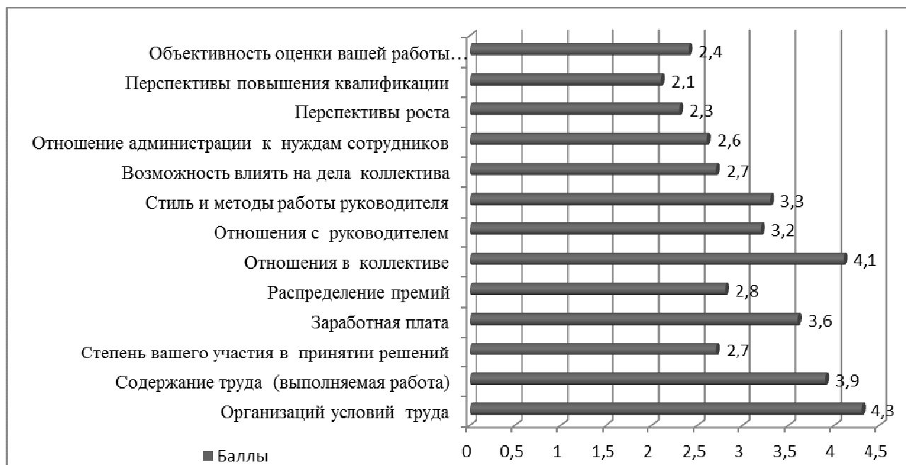
Рисунок 1 – Удовлетворенность системой мотивации работников (средний балл по результатам опроса)

Оценка остальных элементов мотивации труда имеет более низкое значение (исходя из анкетирования, большая часть работников фирмы не удовлетворена ими). Наименьшую оценку элементов действующей системы мотивации труда дали: перспективы повышения квалификации 2,1 б. Это говорит о том, что недостаточно развито обучение сотрудников, нет возможности повышения навыков, образования. Либо очень плохо развит коэффициент трудового участия.