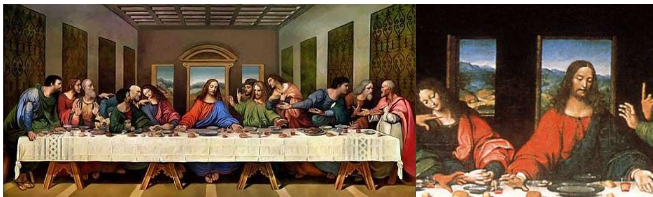
Рис. 2. Просвет меж Христом и Марией — V , Вино, Суть V 'ѣчери

О V, Кубке, рек Браун под видностью М как о Чаше, из коей Христос поил мужей на V 'ѣчере. Истинно, буква сия на твореньи да Винчи — просвет меж Христом и Марией, Жены печать (рис. 2).