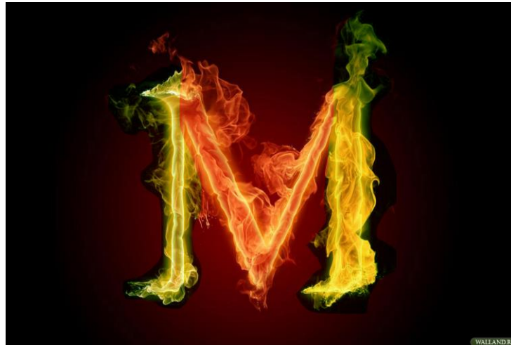
Рис. 3. Буквы V и M: корень и плод

Таким образом, код Леонардо — не М, но V, Центр ее: не Мать-портрет, Это глаз как Познания нуль, и ММанентность, по Брауну, — но Мать-То, Глубь, Трансценденция: Жена как Суть, Лоно — Мир, нас влекущий в Себя самое . Буква V — Глуби имя: предлог В, V' нутри, лат. in: Иное — Глубь, Суть под коркою; Глуби муж — инок : То в Сем как в ларце золотой. V и M в связи их — глубь и зримость, причина и следствие, корень и плод (рис. 3).