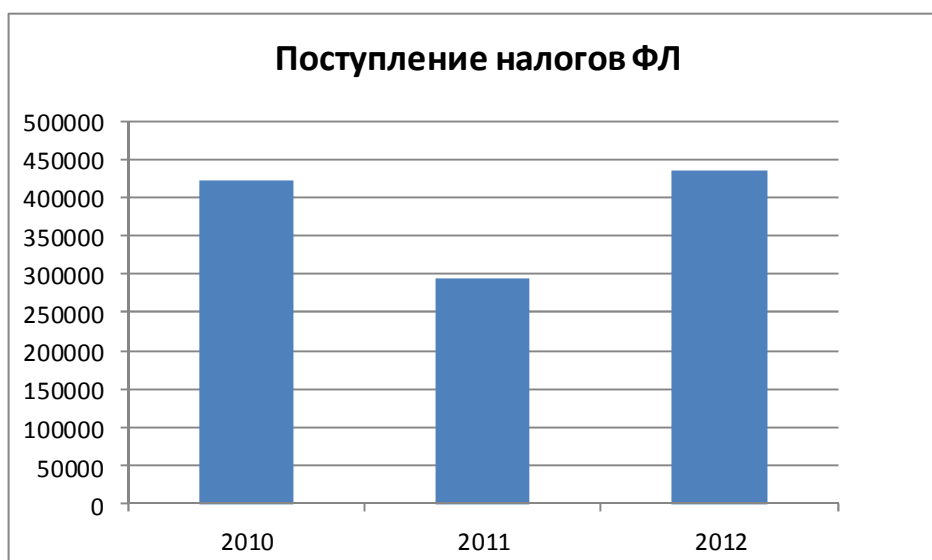
Рис. 1. Поступление налогов по отдельному налоговому периоду

Если суммировать все налоги по отдельному налоговому периоду, то становится видно, что поступления по имущественным налогам по состоянию на 01.01.2013 года составили 434 млн. руб., что на 49% больше показателя 2011 года (рис. 1).