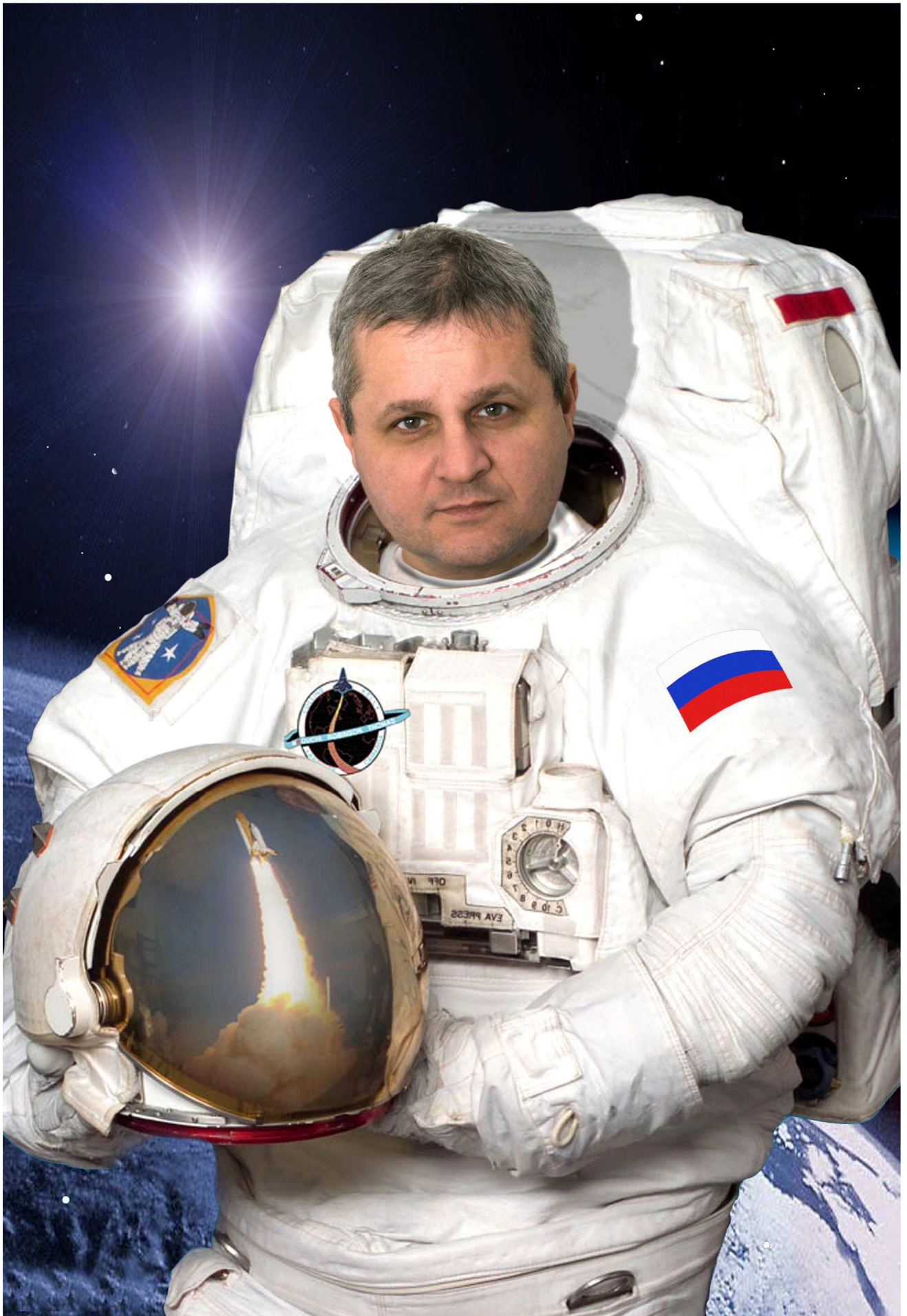
L una * O leg * V ladimirovich * E rmakov