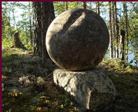
Фото. Сейд, менгир северян

Что есть область сия? В ней Земля и Луна, Ложь и Истина слиты ма'caus' ка к ма|куш|ке ; единство их — сейд ло парей , людей Севера , ма'cou' ки глаз: мен|гир|Мен|ы , Луны, камень на камне как Вечность на брении, Луна на Земле, Шар на куб|е , гнезде ( куб|ло — укр.) бранных, над тьмой Огнь ( см. ).