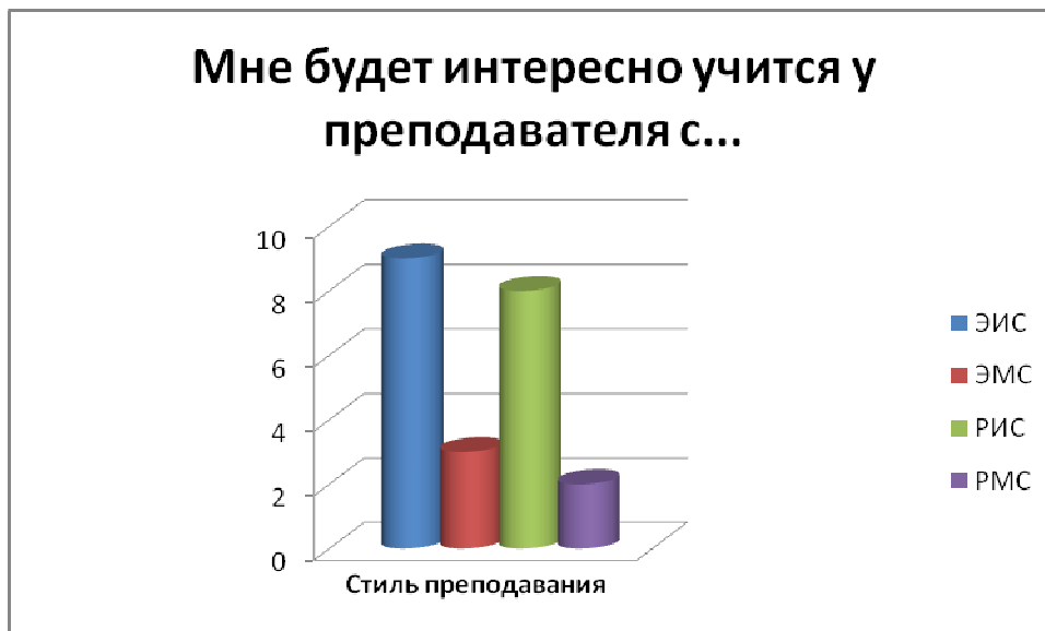
Диаграмма 1. Эмоциональное отношение студента к различным стилям преподавания.

По ответам на второй вопрос получается, что наилучшие результаты обучения студенты предполагают получить у преподавателя с рассуждающе-методичным стилем преподавания.