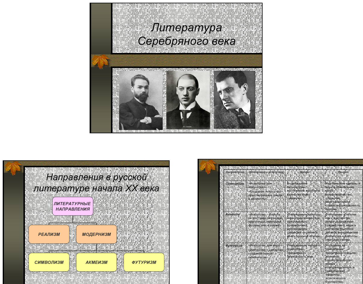
Рис. 1. Слайды из презентации «Серебряный век русской поэзии»

Например, на этапе актуализации знаний при изучении темы «Серебряный век русской поэзии» я подготовила электронную презентацию (Рис. 1), позволяющую вспомнить изученный теоретический материал и осуществить подготовку к практическому занятию.