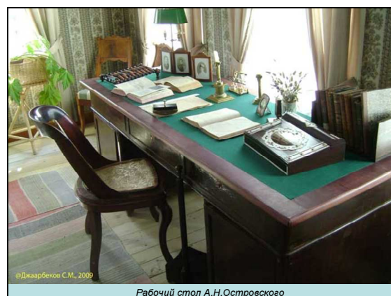
Рис. 2. Слайды из презентации «Усадьба Щельково. Дом-музей А.Н. Островского»

В качестве рекомендаций по применению презентаций на лекциях можно выделить следующие положения: