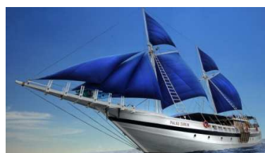
Рисунок 3 – Творческий источник

Творческий источник, на основе которого создавалась коллекция обуви, представлен на рисунке 3. Данная картина является отражением морского стиля, цветовое решение моделей соблюдалось согласно творческому источнику.