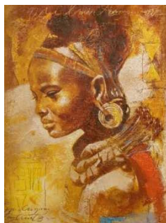
Рисунок 1 – Творческий источник

Творческий источник, на основе которого создавалась коллекция обуви, представлен на рисунке 1.