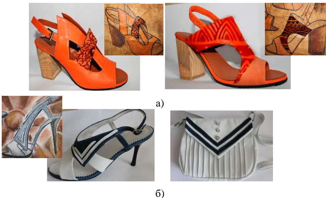
Рисунок 5 – Коллекции женской повседневной обуви на основе образно-ассоциативного восприятия творческого источника