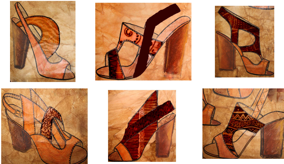
Рисунок 2 – Эскизная проработка коллекции женской повседневной обуви на основе образно-ассоциативного восприятия творческого источника

При выполнении курсовой работы на тему: «Создание коллекции женской повседневной обуви на основе образно-ассоциативного восприятия морского стиля», была разработана коллекция женской повседневной обуви и кожгалантерейных изделий.