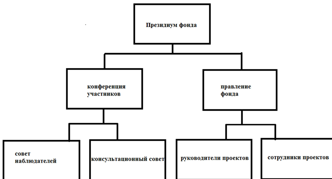
Рис. 3. Возможная структура благотворительной организации

Президиум благотворительного фонда составляют его учредители, меценаты или спонсоры.