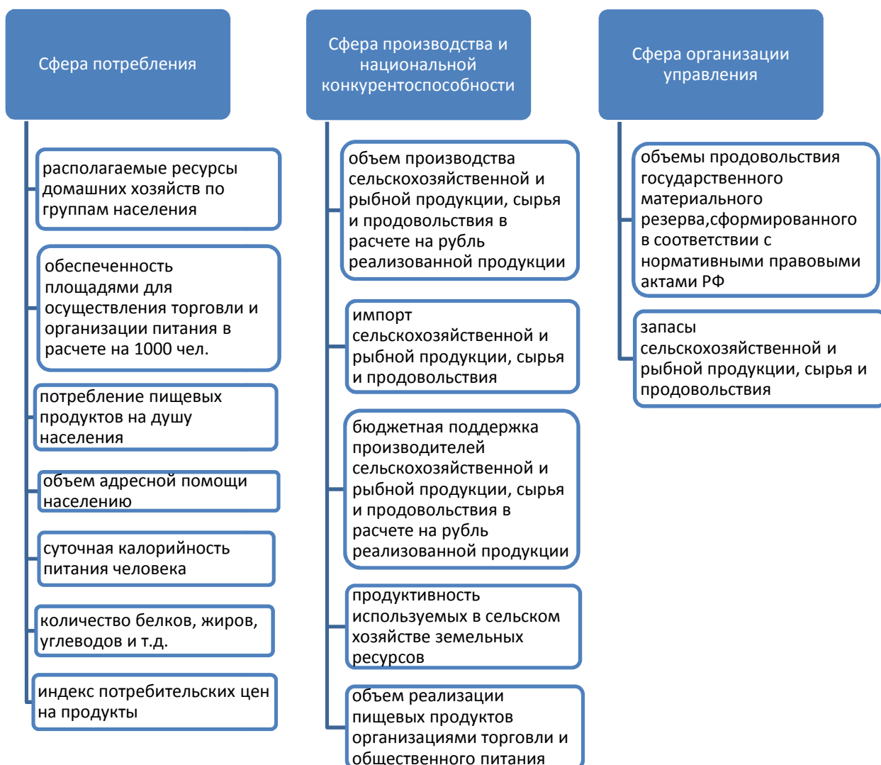
Рис.1 – Оценка состояния продовольственной безопасности, при использовании системы показателей [авторская разработка].

По данным Минздравсоцразвития, Россия только на 60% обеспечена собственным мясом, на 80% — молоком, 58% — сахаром, 84% — овощами и на 40% — фруктами, остальное — импортные поставки [5].