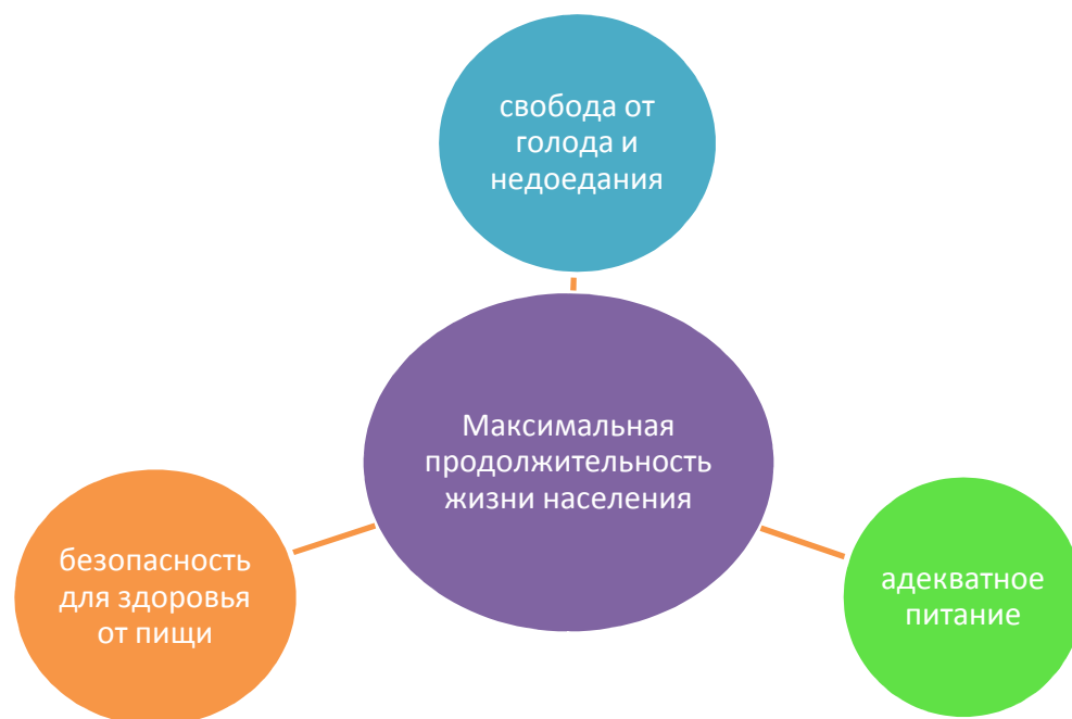
Рис.2 – Максимальная продолжительность жизни населения [авторская разработка].

Благосостояние в сфере питания - наличие достаточного количества высококачественной пищи, удовлетворяющей потребности человека и обеспечивающей ему максимальную продолжительность жизни.