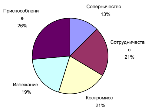
Рис. 2.2.1 Предпочтительность стиля поведения подростков в конфликтных ситуациях.

По результатам проведенного исследования можно сделать вывод о том, что наибольшее предпочтение подростки отдают стратегии приспособления 26%, это значит, что большинство подростков приносят в жертву собственные интересы ради других. Это объясняется важностью общения со сверстниками, желанием быть похожими друг на друга и, соответственно, приспособляться друг к другу.