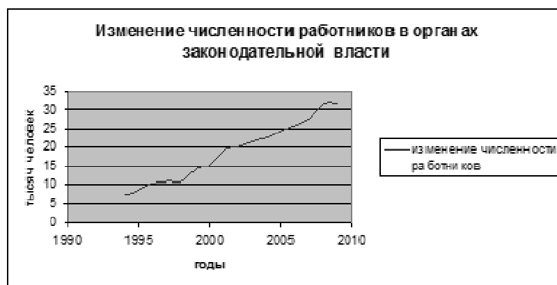
Рис. 2 Изменение численности работников в органах законодательной власти