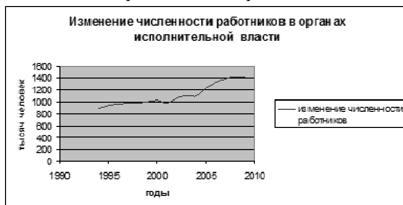
Рис. 3 Изменение численности работников в органах исполнительной власти

Рисунки 1, 2 и 3 наглядным образом демонстрируют тенденцию последних 15 лет к увеличению численности работников во всех сферах государственной власти.