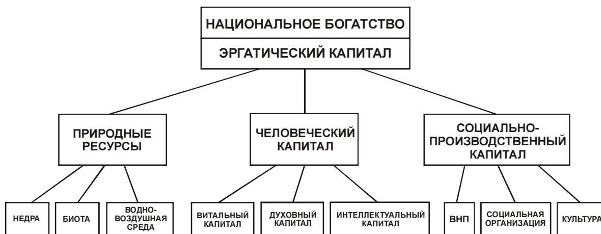
Рис. 1. Структура эргатического капитала 3

При формировании этой схемы учтена примерная равноценность составляющих одного уровня. Для количественной оценки величины каждой из составляющих использовано правило равнозначности маргинальных оценок, свойственных различным странам с явно выраженным приоритетом той или иной составляющей эргатического капитала. Так, для удельных (в расчете на 1 человека) годовых приростов того или иного вида капитала принято равенство