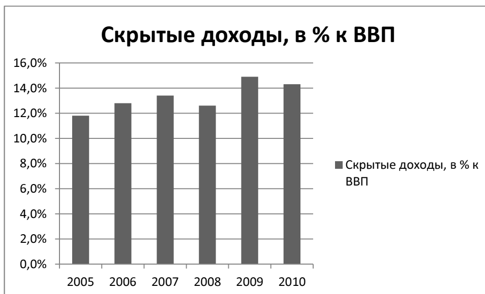
Рис.1.Составлено по официальным сайтам Федеральной службы государственной статистики URL: http://www.gks.ru/wps/wcm/connect/rosstat/rosstatsite/main/

По данным Росстата рассчитаем объем скрытых доходов населения России и проследим динамику данного показателя за 2005-2010 гг. Полученные данные отражены на следующей диаграмме.