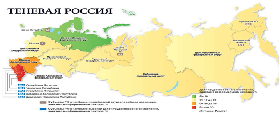
Рис.2 Теневая Россия.

На основе исследования по методологии Росстата были выделены субъекты с наиболее высокой долей трудоспособного населения: Республика Дагестан -48,4% и Чеченская республика-50,7 %.В целом Южный федеральный орган опережает Россию по объему теневой экономики (более 30 %). Самый низкий % теневой экономики отмечается в Северо-Западном федеральном округе-до 10 %, в основном по России от 10 до 20 %