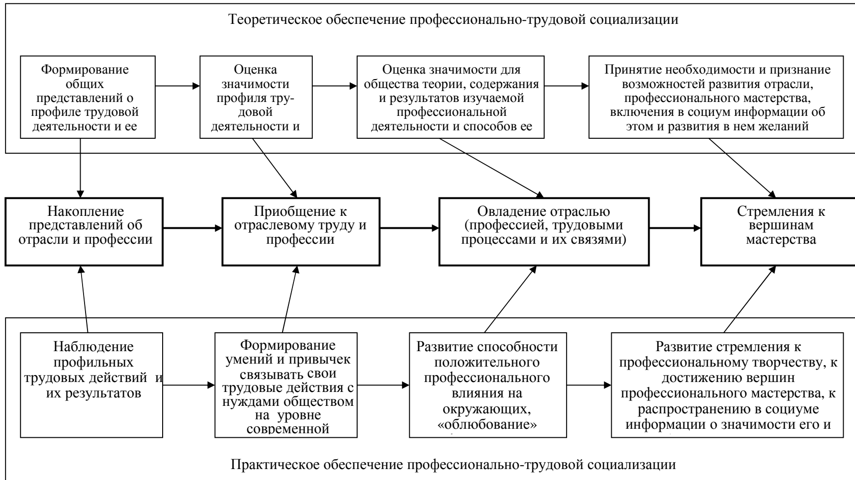
Рис. 1. Логика развития профессионально-трудовой социализованности в процессе непрерывной подготовки кадров.