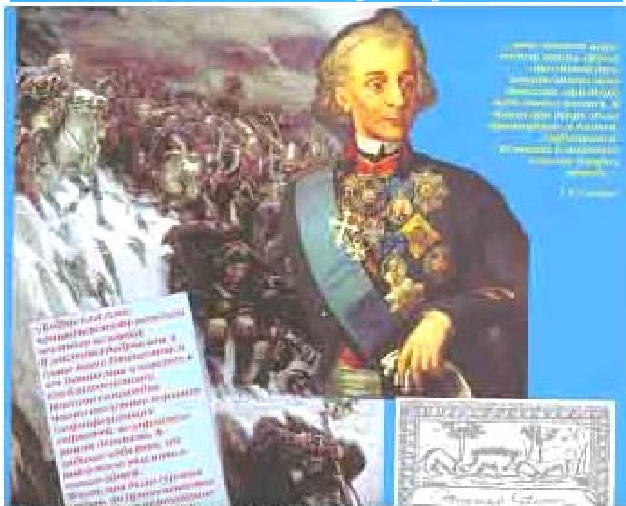
Портрет А.В. Суворова. НА ФОНЕ КАРТИНЫ ПЕРЕХОДА ВОЙСК ЧЕРЕЗ АЛЬПЫ