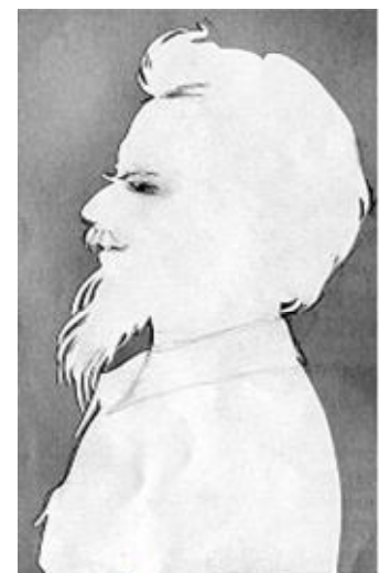
Май 2001 /силуэт