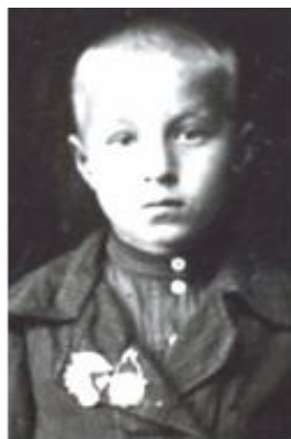
Июль 1943. 7 лет Война Голод. Снимок после кончины мамы 20.7.1943