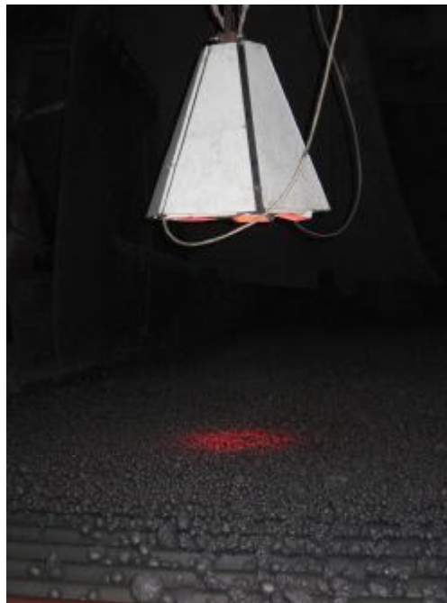
Рис.1. Расположение УСВ над роликовым грохотом технологической линии №8 обжиговой машины №2 Костомукшского ГОКа

Промышленные испытания бесконтактной гранулометрической компьютерной системы «Индикатор крупности» проводились в разное время на различных предприятиях: Качканарский ГОК (1995г.), Лебединский ГОК (2001г. и 2005г.), Михайловский ГОК (2003г. и 2004г.). В настоящей статье приводятся результаты длительных (более месяца) промышленных испытаний на Костомукшском ГОКе.